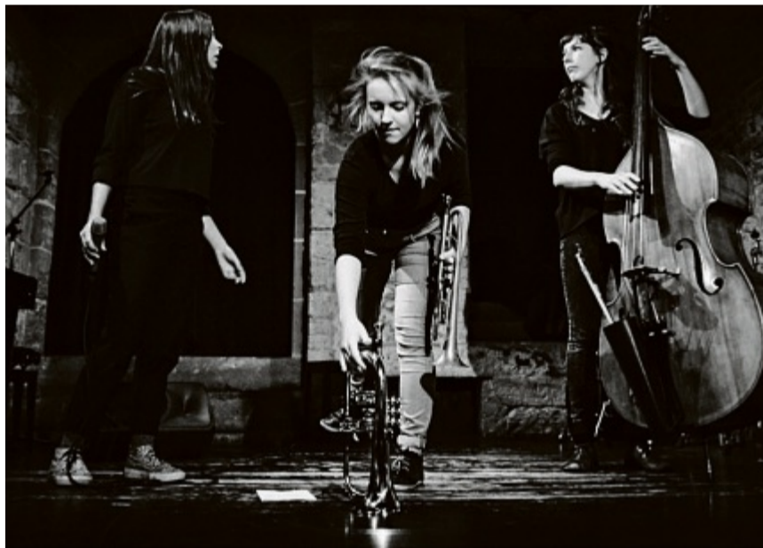
Lädt mit Pop und Jazz in ihre sonderbar-fabelhafte Klangwelt ein: Die Drei.